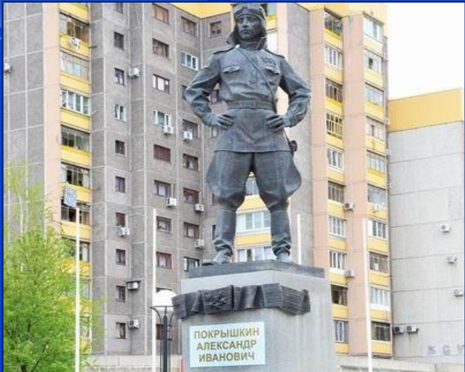
Памятник А. Покрышкину